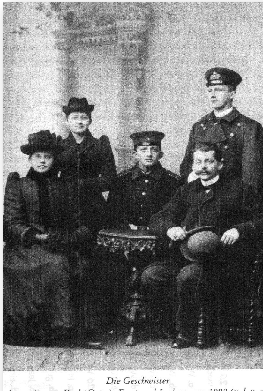
Les frères et sœurs du Comte Ernst de Reventlow (debout à droite)